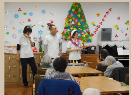
クリスマス会 (忘年会・新年会もあります)