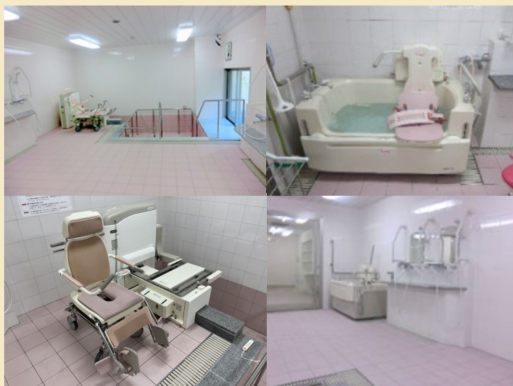
清潔で広々とした浴室