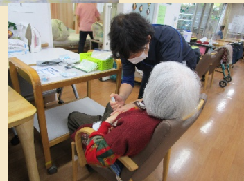
看護師がインスリン注射のお手伝いをいたします