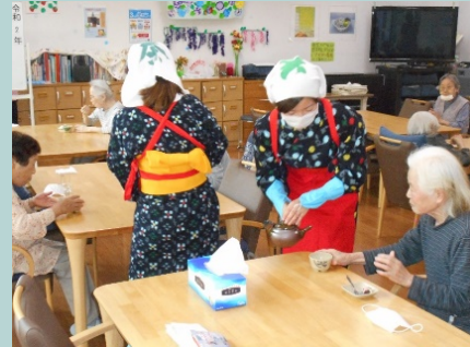
お茶娘 (厨房スタッフが新茶を振る舞います)