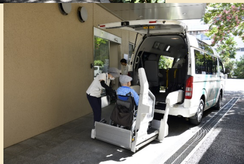
車椅子リフト付き送迎車